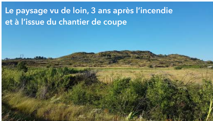
Le paysage vu de loin, 3 ans après l'incendie et à l'issue du chantier de coupe

car cela permet aussi de pailler et nourrir les sols, mais ce n'était pas au contrat. De même, il reste des arbres près du Dolmen qui n'ont pu être évacués, car les engins ne peuvent accéder à cette combe. Enfin, certaines voiries communales ont été endommagées et l'entreprise s'est engagée à participer à leur remise en état.