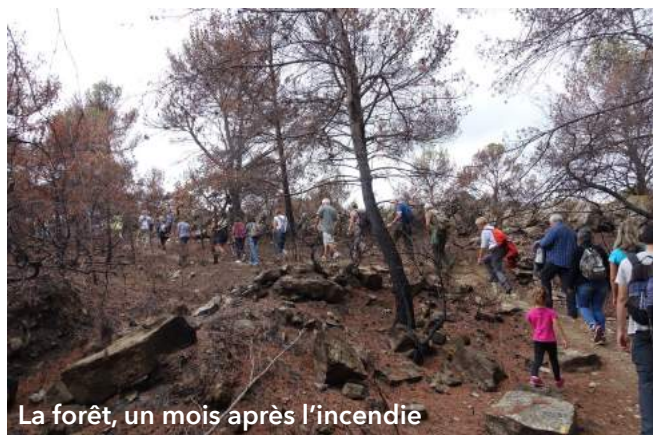
La forêt, un mois après l'incendie