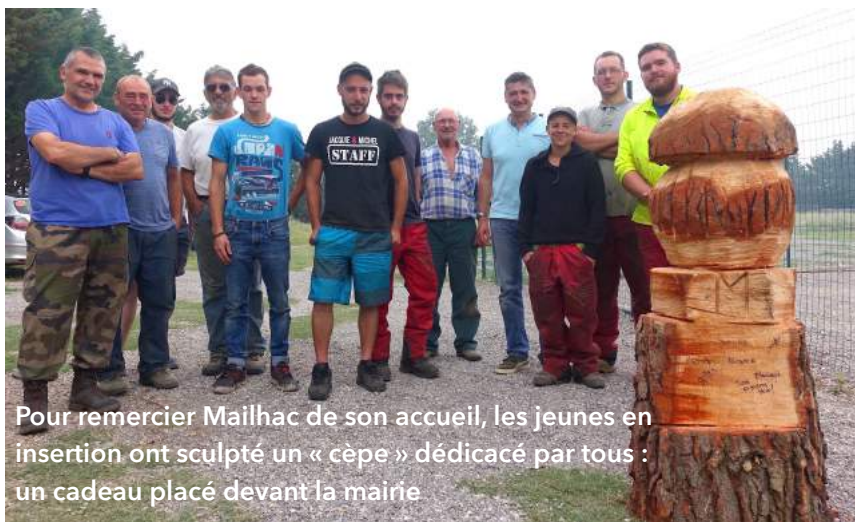
Pour remercier Mailhac de son accueil, les jeunes en insertion ont sculpté un « cèpe » dédié par tous : un cadeau placé devant la mairie

En juin , 6 étudiants en CAP Travaux forestiers au lycée Saint-Joseph de Limoux sont venus 2 jours durant, épauler les chasseurs dans le débroussaillage d'une zone entre forêt et garrigue sur le Pech.