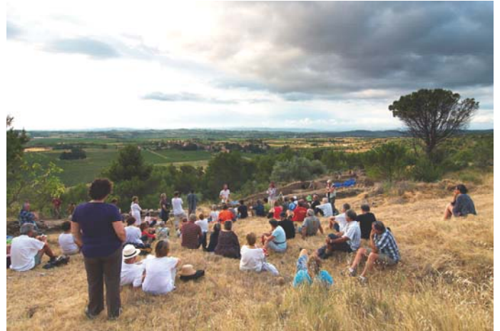
Les archéologues ont présenté leur travail aux marcheurs

Reste toute la collection de livres et manuscrits scientifiques, qui a aidé Odette et Jean dans leurs recherches : la commune entend mettre à disposition une salle de la maison Maraval pour archiver ce volume considérable de documents. L'ancienne directrice des archives départementales de l'Hérault a proposé de lui apporter son aide dans ce travail d'envergure.